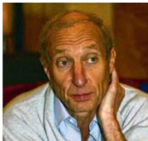
Au fil de ses livres, Jean Hatzfeld a rencontré les survivants comme les bourreaux.

À force d'égrener le récit du malheur, on pourrait oublier que le Rwanda est beau, qu'il fut harmonieux et que, même aujourd'hui, ses habitants rêvent du bonheur perdu et s'emploient à le retrouver. Scholastique Mukasonga, qui nous avait déjà donné un récit imaginaire (mais combien probable) Notre Dame du Nil , qui obtint le prix Renaudot, s'est désormais penchée sur ses souvenirs. Comme bien d'autres Tutsis, sa famille avait été déportée dans la région aride du Bugesera, mais sa mère, au fil des récits dont elle berçait sa fille, avait entretenu le culte de la rivière fondatrice, la Rukarara, dont l'eau guérissait, calmait, enchantait ses riverains.