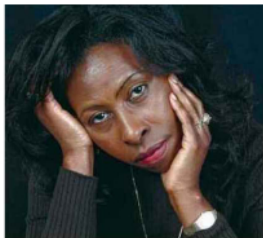
Scholastique Mukasonga évoque les histoires des temps anciens d'un Rwanda traditionnel.

récit Englebert des Collines JEAN HATZFELD Gallimard. 112 p. ; 12 euros